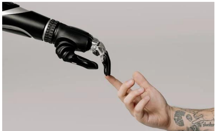
Abbildung: KI vs. Mensch

Seid neugierig, probiert Dinge aus und lasst euch inspirieren – die Zukunft der Arbeit mit KI beginnt jetzt, und ihr seid mittendrin!